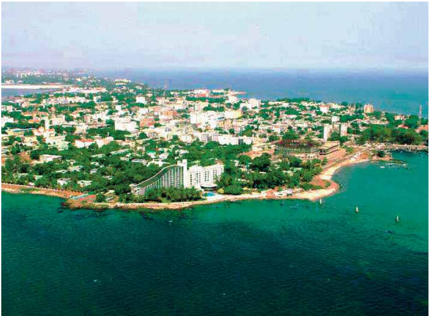
Conakry – Presqu'île de Kaloum –

Le centre historique de Conakry se situe sur la presqu'île de Kaloum, à Tombo. La ville a ensuite largement débordé à l'intérieur des terres, à l'image de la croissance géographique et démographique de toutes les grandes métropoles africaines.